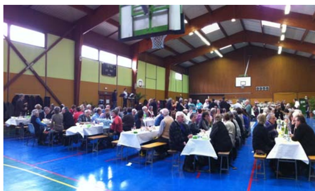
Repas «Carpe Frite» du 27 février dernier organisé par les «Amis du Forum»